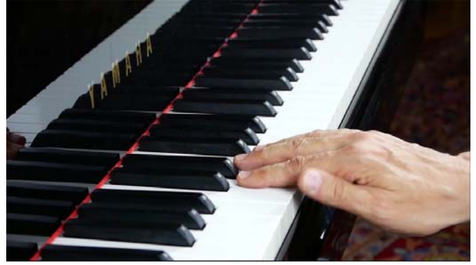
Schlecht: flache Hand